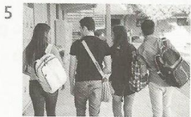
go into the term / Year 8