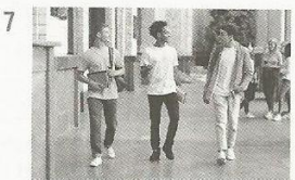
leave assembly / school