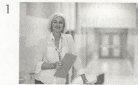
head teacher / tutor

Ćwiczenie nr 1. Wybierz odpowiednie słowa.