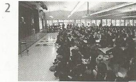
go to assembly / detention