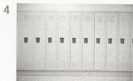
leave things in your report / locker