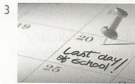
school absent / term