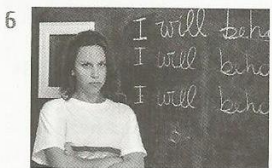
get detention / school