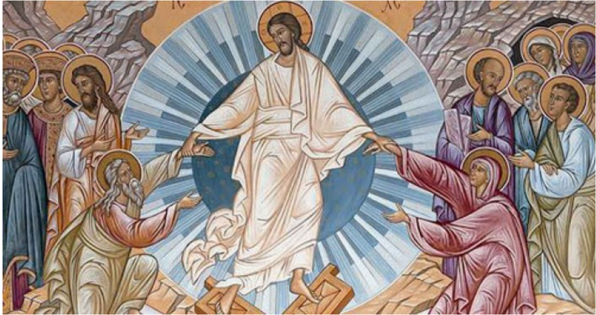
Ilustracje poniżej przedstawiają Wniebowstąpienie Pana Jezusa.