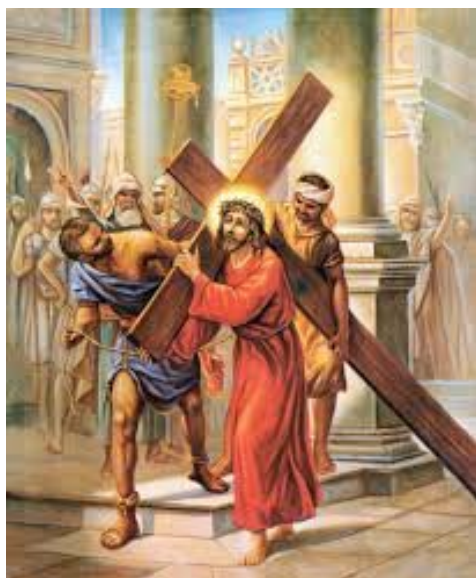
Pan Jezus niesie krzyż.

Warto w tym miejscu przypomnieć krótko wydarzenia Wielkiego Piątku , gdy Pan Jezus szedł drogą Krzyżową i został ukrzyżowany (zobacz na ilustracje poniżej).