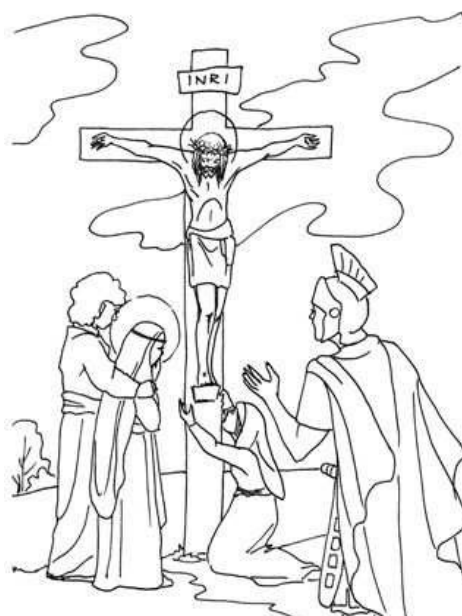
Pan Jezus umiera na Krzyżu.