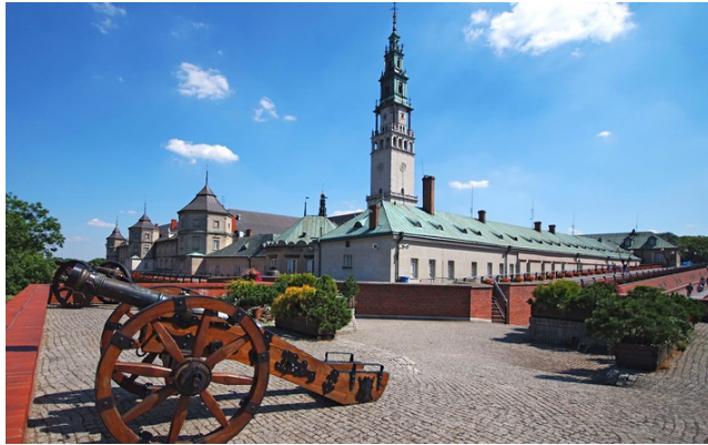
Jasna Góra w Częstochowie

Maryja jest bardzo dobrą Matką. Z wielką miłością i troską zajmowała się Jezusem. Nigdy nikomu nie odmówiła pomocy i zawsze wszystkich cierpliwie wysłuchiwała. Dlatego teraz ludzie proszą Ją w modlitwie w różnych sprawach, a Ona zanosí wszystkie próby do Jezusa. Dlatego często nazywamy Maryję: Pośredniczką, Wspomożycielką, Pocieszycielką, Orędowniczką. Ku czci Maryi ludzie stawiają figury, budują kapliczki, kościoły i wielkie bazyliki. Najbardziej znane sanktuaria maryjne w Polsce to: