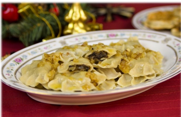
pierogi z kapustą i grzybami