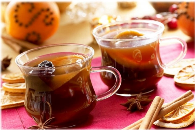
kompot z suszu