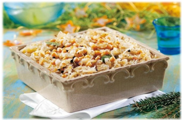
kapusta z grochem