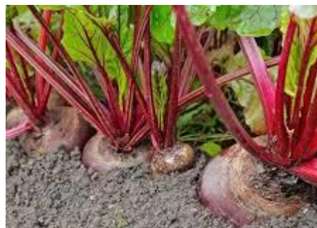
- burak ćwikłowy