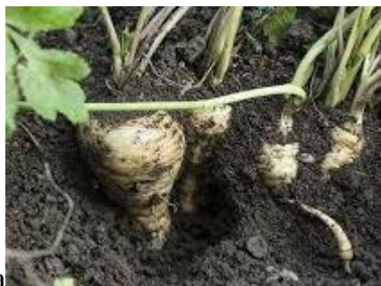
- pietruszka korzeniowa