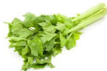
- seler listkowy