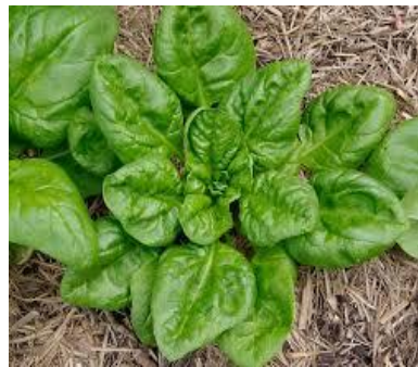
- szpinak zwyczajny