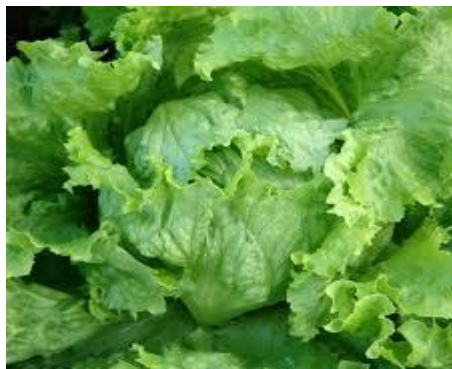
- sałata krucha