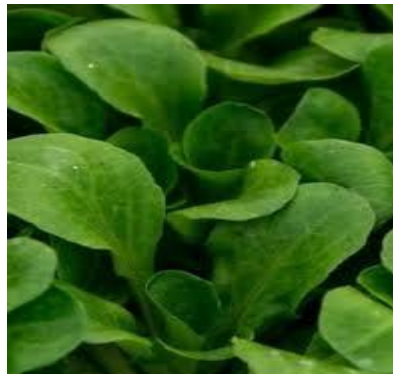
- cykoria liściowa