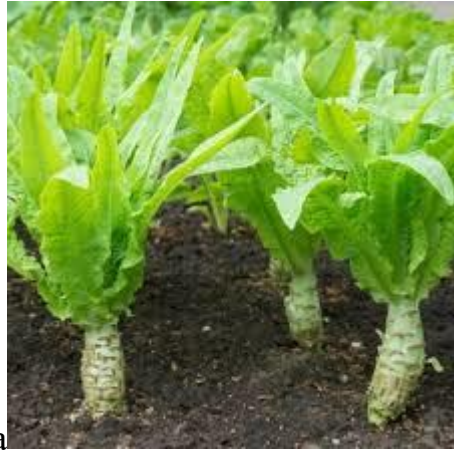
- sałata łądygowa