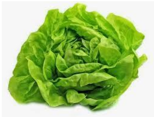
- sałata masłowa