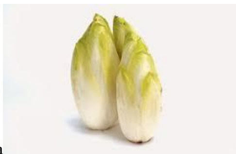
- cykoria sałatowa