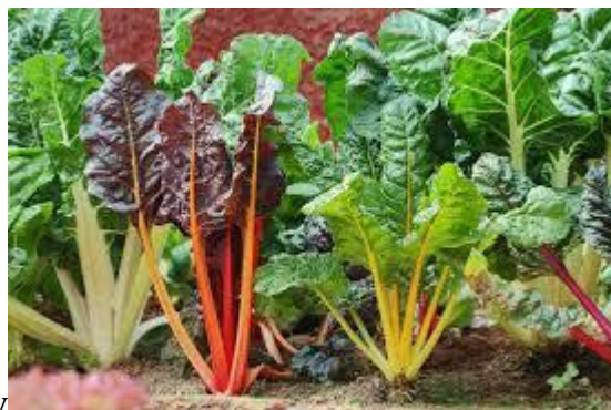
- burak liściowy