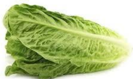
- sałata rzymska