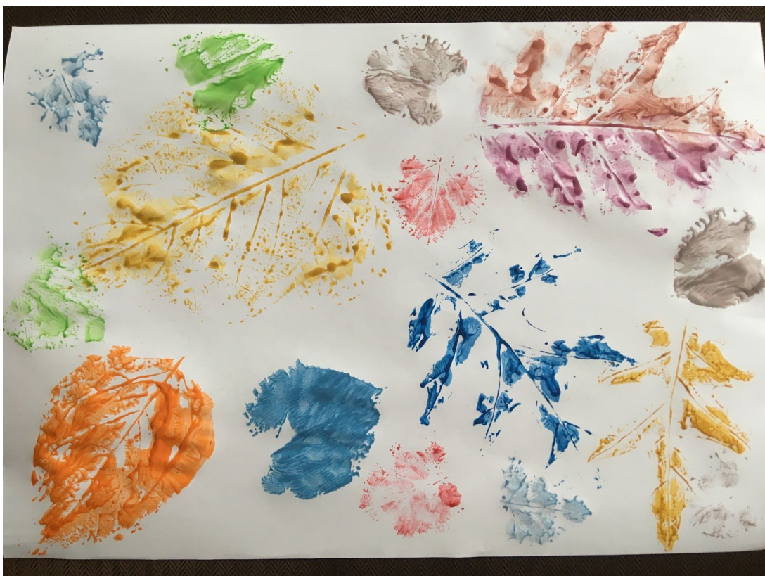
Piękna kolorowa jesienna kompozycja!