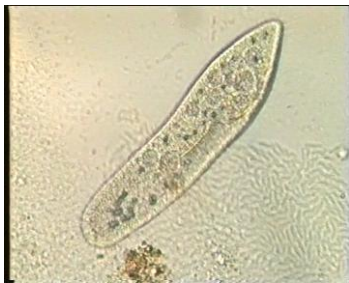
paramecium żyjący w wodzie