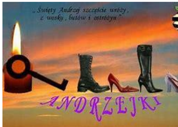
Zabawa z butami

Skorzystaj z zaprezentowanych propozycji i pobaw się w ten dzień w domu. Udanej zabawy.