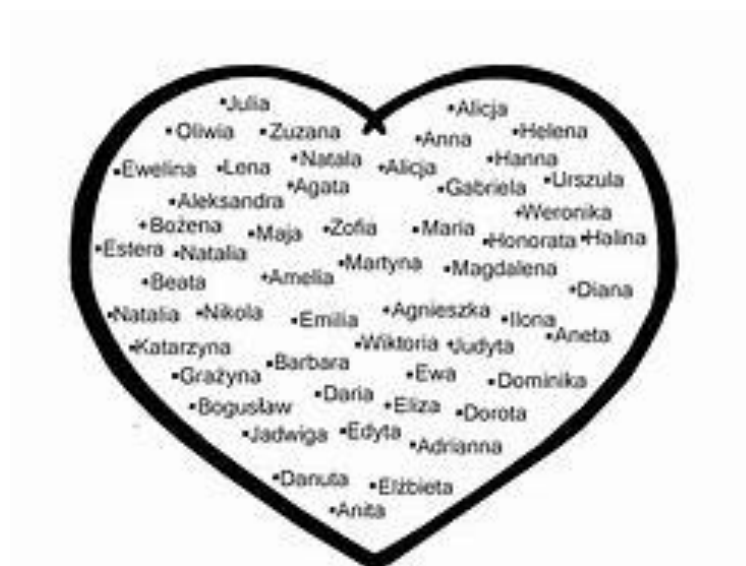
Serce z imionami