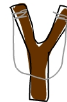
celuje z procy