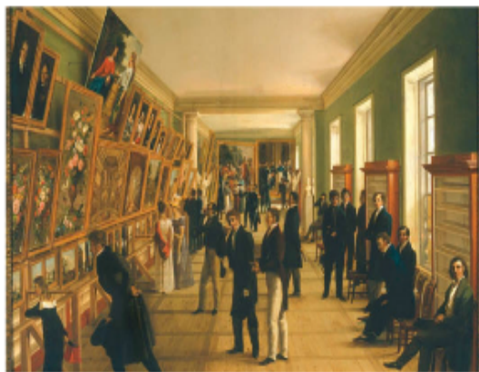
Widok Wystawy Sztuk Pięknych w Warszawie w 1828 roku to obraz Wincentego Kasprzyckiego, namalowany jeszcze w trakcie zaborów.