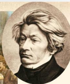
LITERATURA ADAM MICKIEWICZ (1798–1855)

Ilustracja do Pana Tadeusza , jednego z najważniejszych dzieł Adama Mickiewicza. Poemat ten powstał na emigracji i wyraża tęsknotę poety za krajem lat dziecińczych. Mickiewicz dużo podróżował i angażował się w politykę. Liczył na wyzwolenie ojczyzny, do której już nigdy nie udało mu się powrócić.