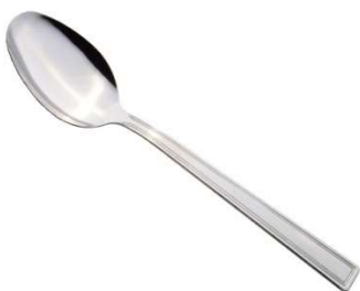
łyżeczkę do mieszania i nakładania farb