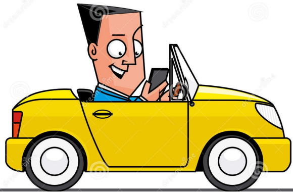
drive a car