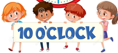
tell the time