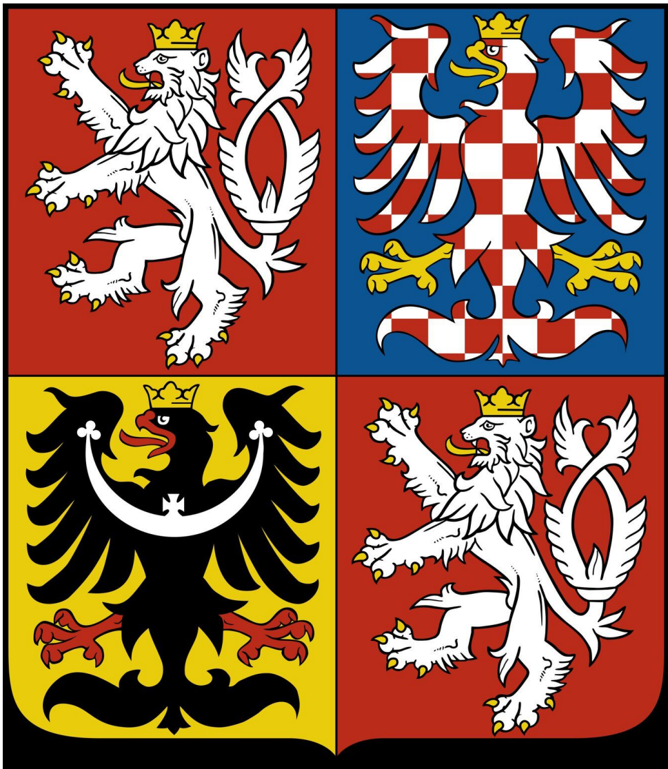
Opracowała, Svitlana Pavlenko