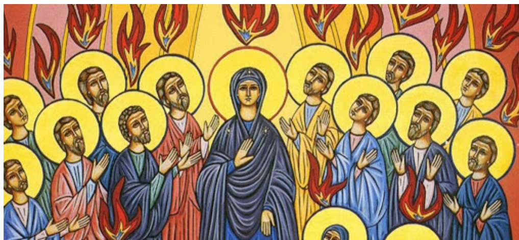
Ilustracja nr.2 - też przedstawia scenę Zesłania Ducha Świętego.