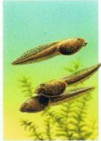
Z jaj wylęgają się kijanki.