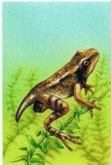
Ogon się skraca i wyrastają przednie kończyny.