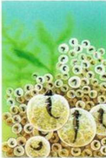
Samica znosi tysiące jaj.