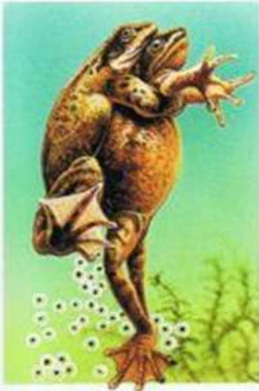
Samiec zapładnia samicę.