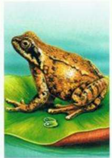
Kijanka jest już żabą i opuszcza wodę.