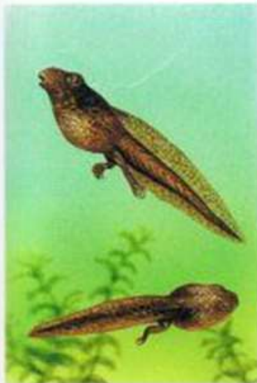
Kijankom wyrastają płetwiaste kończyny.