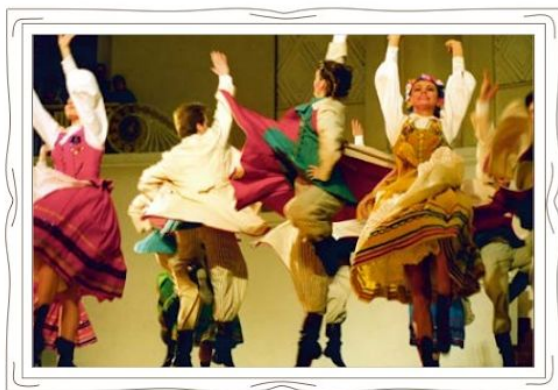
Pelen wigoru charakter oberka znajduje odzwierciedlenie zarówno w muzyce, jak i w ruchach tancerzy.

Polscy kompozytorzy z XIX i XX w. nieraz wykorzystywali w swoich utworach wesoły, żywiołowy rytm oberka. Nawiązania do tego tańca można usłyszeć m.in. w dziełach Fryderyka Chopina, Henryka Wieniawskiego czy Grażyny Bacewicz.