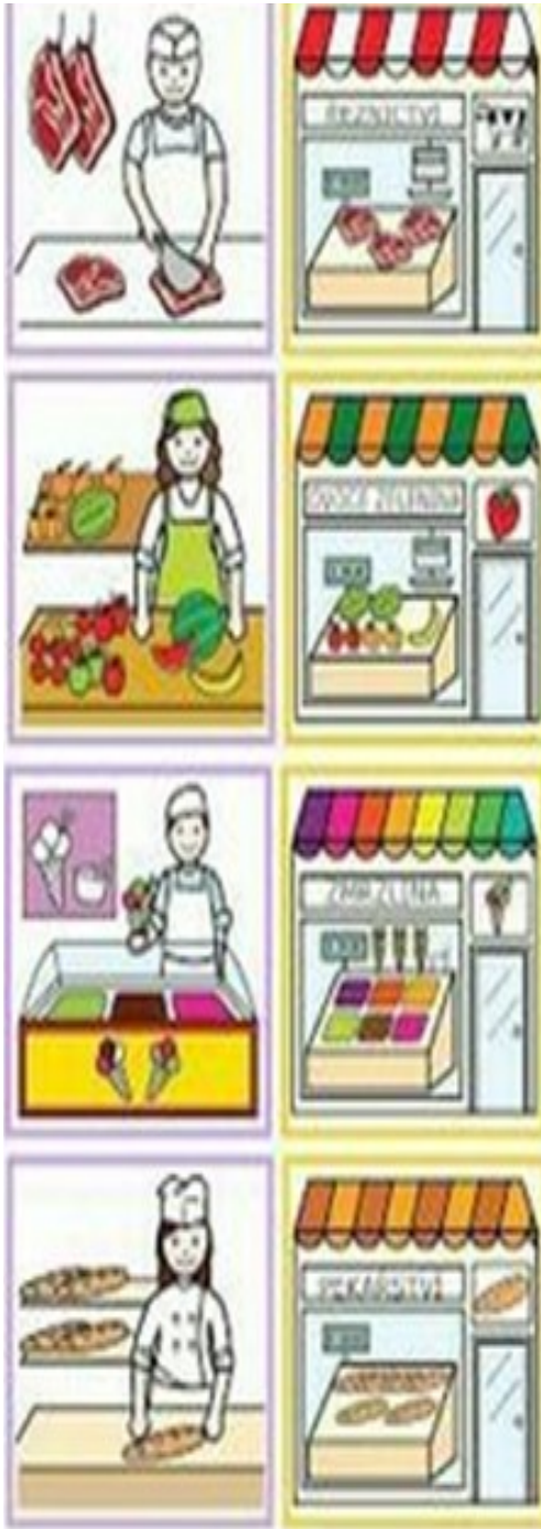
To są sprzedawcy.