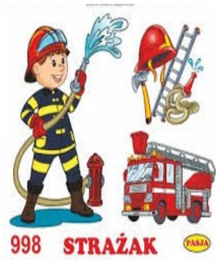
To jest strażak.

https://www.youtube.com/watch?v=M6WVB7CV44I