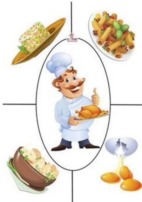
On gotuje i przyrządza potrawy

https://www.youtube.com/watch?v=NCn20pfHDKk