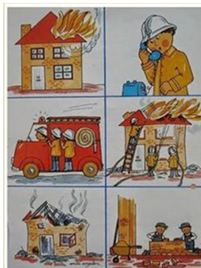
On gasi pożary.

https://www.youtube.com/watch?v=M6WVB7CV44I