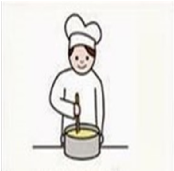
To jest kucharz

https://www.youtube.com/watch?v=NCn20pfHDKk