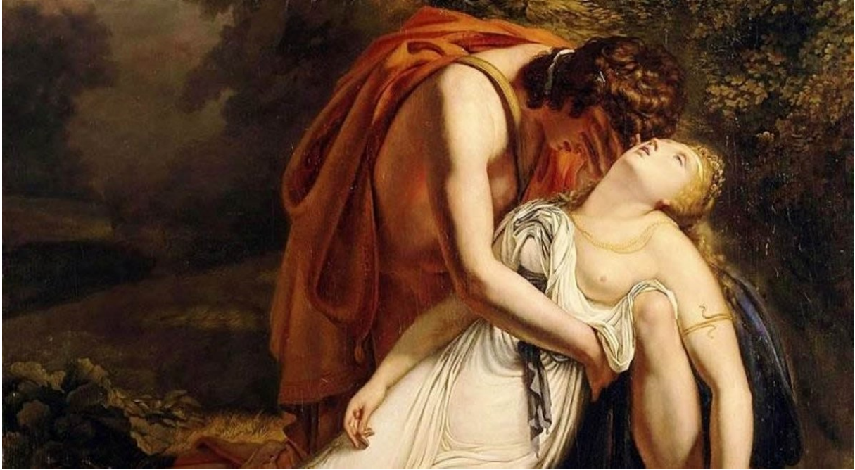
Orfeusz nie może się pogodzić ze stratą ukochanej.