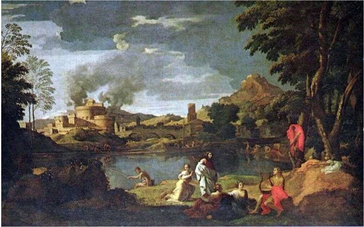
Orfeusz i Eurydyka – Nicolas Poussin