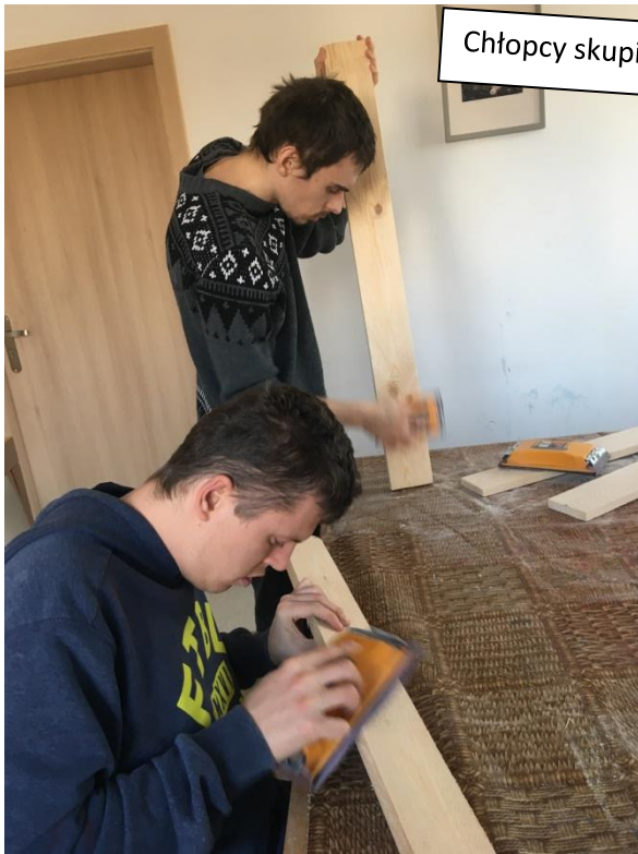
Chłopcy skupieni na pracy