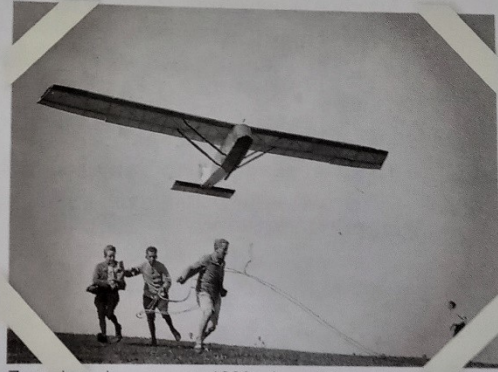
Zawody szybowcowe w 1923 roku w Niemczech

Antoine de Saint-Exupéry jest uważany za pisarza moralistę. Jego przemyślenia na temat obowiązków człowieka względem innych, międzyludzkiej solidarności i wierności sobie znalazły wyraz w utworach Nocny lot , Ziemia, planeta ludzi i Cytaśela . Wartościami, które najwyżej cenił, były odpowiedzialność, przyjaźń i odwaga.