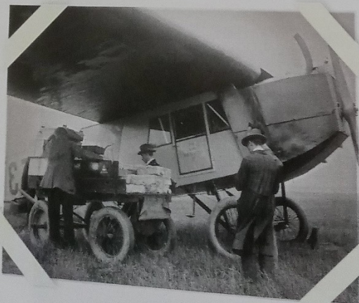
Samolot transportowy z 1924 r. odbywający loty na trasie Niemcy – Holandia

Zmuszeni do lądowania na wysokości czterech tysięcy metrów na płaskowzgórzu o pionowo spadających ścianach, Mermoz i mechanik, który mu towarzyszył, przez dwa dni usiłowali stamtąd się wydostać. Daremnie. Wówczas spróbowali ostatniej szansy: skierowali samolot wprost w przepaść i odbiwszy się od nierównego terenu, zsunęli się w próżnię. Podczas spadania samolot nabrał wreszcie dość szybkości, a kiedy Mermoz poderwał go tuż przed grzbieciem górskim, musnął grzbiet i kiedy po siedmiu minutach lotu woda wytryskała już wszystkimi kanalikami rozsadzonymi