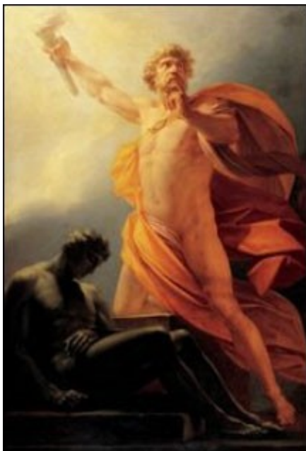
Stworzenie człowieka (Paula Rubensa) –