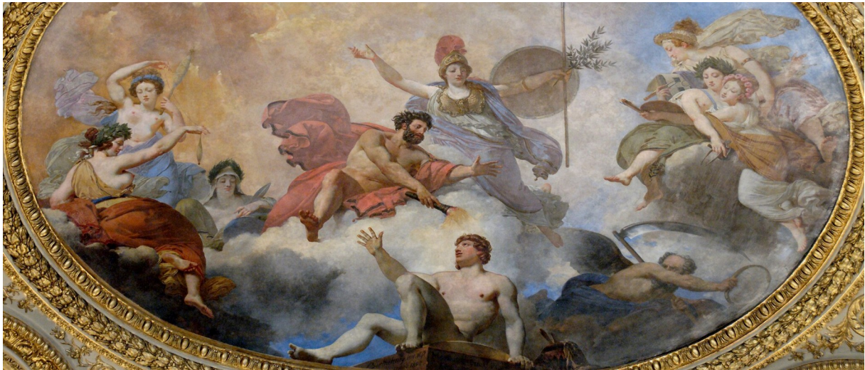
Prometeusz stwarza człowieka przy współdziałaniu Ateny. Jean-Simon Berthélemy, Jean-Baptiste Mauzaisse, Prometeusz stwarza człowieka przy współdziałaniu Ateny, 1802, Muzeum w Luwrze, domena publiczna