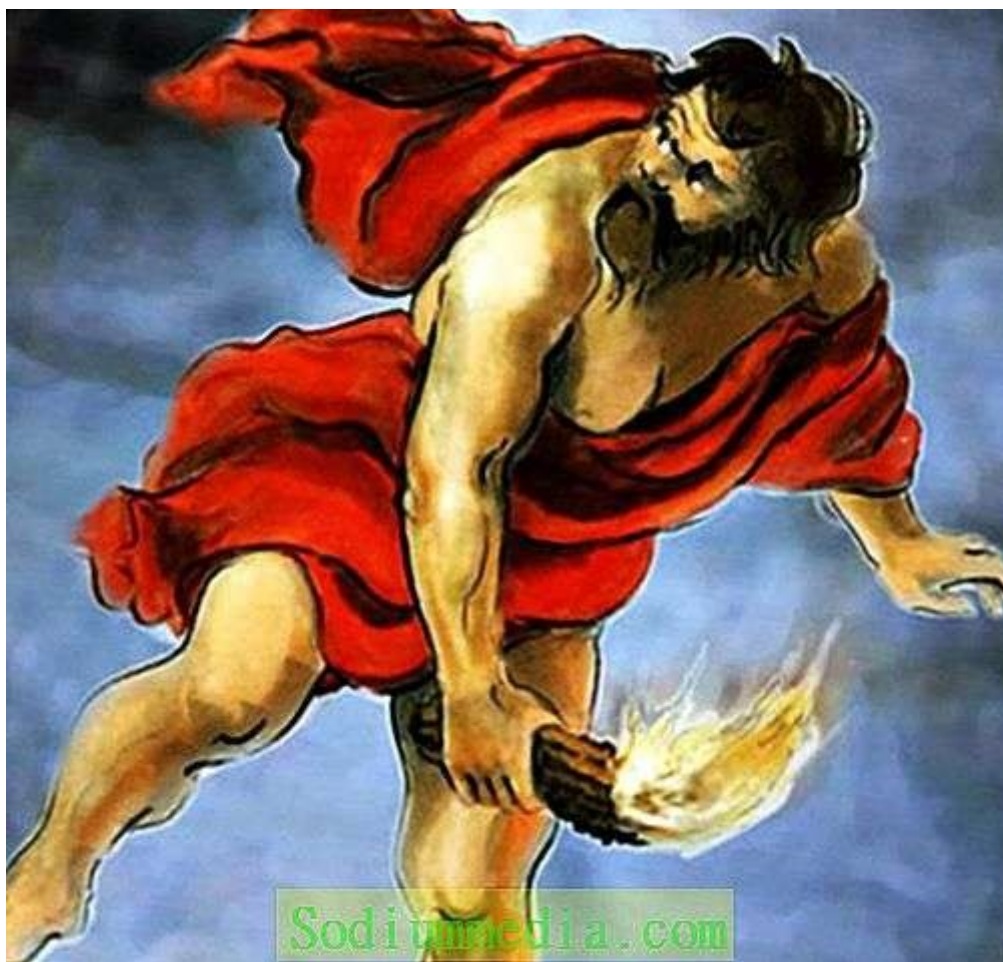
Prometeusz wynoszący ogień, ilustracja do podręcznika