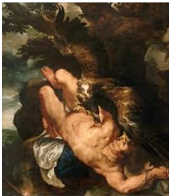
Prometeusz skowany (obraz Petera