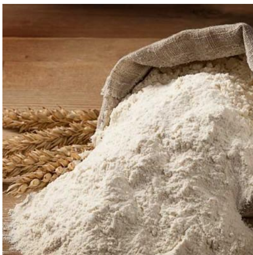
1. Mąka pszenna