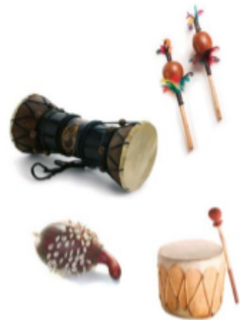
Instrumenty perkusyjne wykorzystywane są w muzyce różnych krajów.

Pierwszy instrument muzyczny powstał prawdopodobnie przez przypadek. W odległej przeszłości jeden z naszych przodków zauważył, że odgłos uderzenia kijem o drzewo płoszy dzikie zwierzęta. Od tej pory ludzie odstraszały w ten sposób intruzów. Z czasem wymyślili więcej narzędzi wydających dźwięki w wyniku uderzania lub potrząsania. Te najprostsze instrumenty perkusyjne służyły na przykład do zwoływania mieszkańców osady na naradę albo do wykonywania muzyki podczas obrzędów plemiennych. Uznajemy je za najstarsze instrumenty świata.